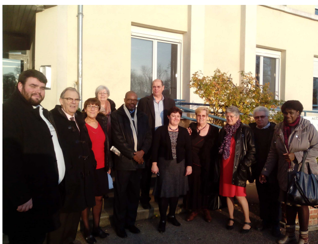
Chez les Compagnons du Devoir, avec le prévôt,, des bénévoles d'HORIZON 54, des élus et représentants de la municipalité