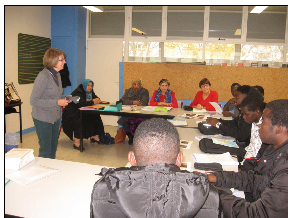
REPONSE en France