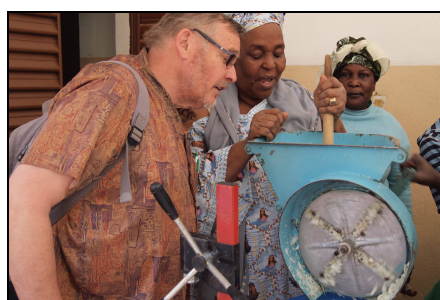
Préparation des oignons séchés