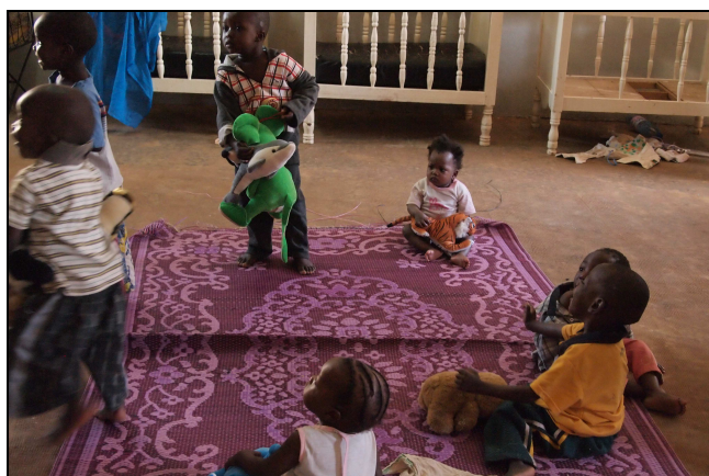
Distribution de peluches

Nous avons également eu des nouvelles d'Alamako, sourde, muette et non voyante. Deux volontaires psychologues avaient travaillé avec elle pendant plusieurs semaines en 2011, avant la guerre dans le Nord du Mali. Elle semble heureuse. Elle est toujours prise en charge par l'orphelinat Niaber, mais vit dans un village, dans une maison qui appartient au centre, entourée des membres d'une famille d'accueil. Elle a maintenant 20 ans environ.