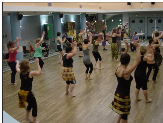
avec les adultes

Dimanche 28 après-midi, nous avons invité les associations ABANA/Arc-en-ciel, BA et NO-NA-ME à participer à notre fête en présentant sur un stand des produits de leur pays (Rwanda, Burkina Faso et Sénégal). Tous les artistes se sont produits gratuitement. Merci à tous les participants, bénévoles et musiciens sans qui FESTI'KOULEURS ne pourrait avoir lieu.