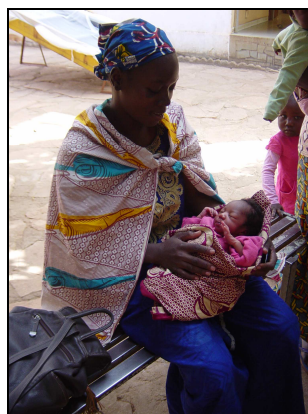
Un tout petit bébé et sa jeune maman