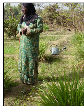
Le jardin de KANUYA

Orphelinat NIABER - ASE/MALI : Ce sont des moments particulièrement émouvants quand nous rendons visite à la pouponnière / orphelinat NIABER. Nous avons apporté du lait en poudre et remis de l'argent pour aider les responsables à payer les nounous qui travaillent au centre.