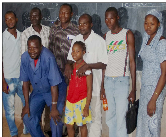
AMEPRE au Mali