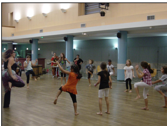
avec les enfants