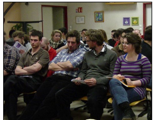
Soirée de découverte du Mali chez les Compagnons du Devoir