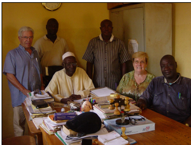
avec les membres du bureau de l'ASACO SAB 1