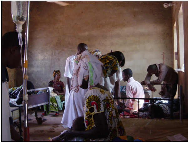
salle de perfusion / malades atteints du paludisme