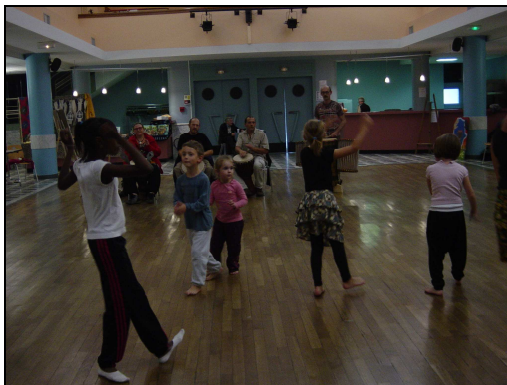
avec les enfants

FESTI'KOULEURS : La fête s'est déroulée sur 2 jours. Samedi 14 Septembre après-midi, une vingtaine de personnes s'est retrouvée à la Salle des Fêtes de Jarville-la-Malgrange pour un stage de danses africaines animé, comme les années précédentes, par Koko et Naïké - en fin d'après-midi, ce sont 10 jeunes enfants qui les ont remplacés, pour 2 heures de danses animées cette fois par Sandrine, bénévole de l'association NO NA ME, notre partenaire.