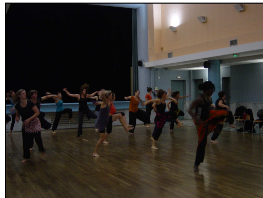
avec les adultes