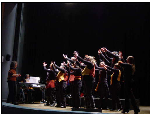
la Chorale "Les Hurléloups"