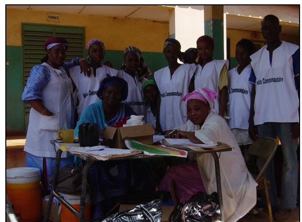
personnel médical à l'accueil